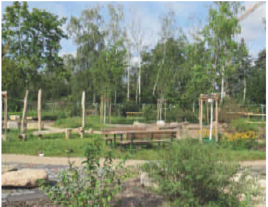
Der neuer Spielplatz unweit des Dransdorfer Friedhofes

Schöne, jedoch kleinere Spielmöglichkeiten gibt es gegenüber den Räumen des Kinderschutzbundes. Dieser Spielplatz hat den großen Vorteil, dass dort auch an