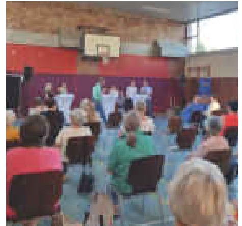
Gründung der neuen ZWAR-Gruppe in der Kettelerschule in Dransdorf

Einige der gewünschten Aktivitäten werden bereits vor Ort von Kooperationspartnern angeboten, zum Beispiel gemeinsames Frühstück. Andere Anregungen, wie die Gründung einer Tischtennisgruppe, konnten schon nach dem zweiten Treffen umgesetzt werden, da im Festsaal des Stadtteilvereins zwei Tischtennisplatten stehen, die seitdem alle zwei Wochen wieder genutzt werden. Auch der Spieletreff bzw. die Doppelkopf-Runde im Stadtteil Café waren schnell organisiert und im November trafen sich erstmals die „Kegelzwarge“ in der Lambertustube und hatten viel Spaß auf der Kegelbahn. Auch Wanderun-