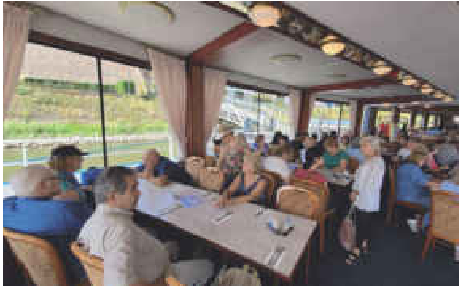
Geselliges Beisammensein an Bord der Poseidon

Das Schiff hatte schon Fahrt aufgenommen, als dann alle ihre Plätze im großen unteren „Saal“ eingenommen hatten. Zwei nette junge Kellnerinnen und ein „alter Hase“, als erster Offizier verkleidet, servierte den Gästen kalte Getränke. Wer noch nicht ganz wach war – so wie ich – bestellte sich einen großen Milchkaffee. Dann kam auch bald das Mittagessen. Das Schiffspersonal servierte die Speisen schnell und zu aller Zufriedenheit. Das war