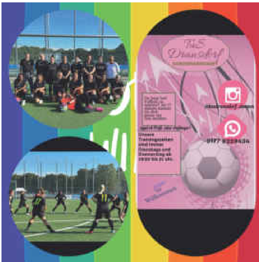
Neue Trikots des TUS Dransdorf Damen Mannschaft