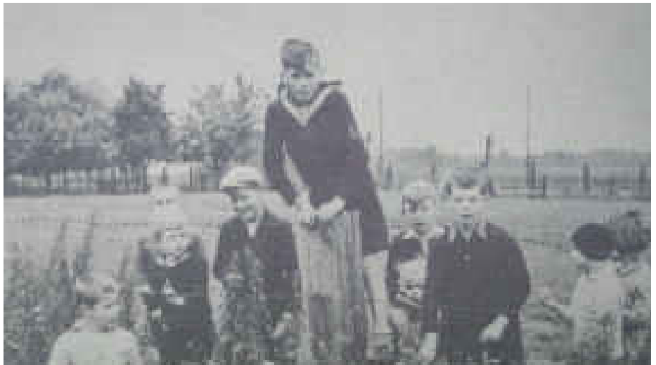
Früher spielten die Kinder gerne an der Dransdorfer Burg

Erst mal liefen alle nach Hause zum Mittagessen. Vorher hatten wir (ein engerer Kreis von vier oder fünf SchulkameradInnen)