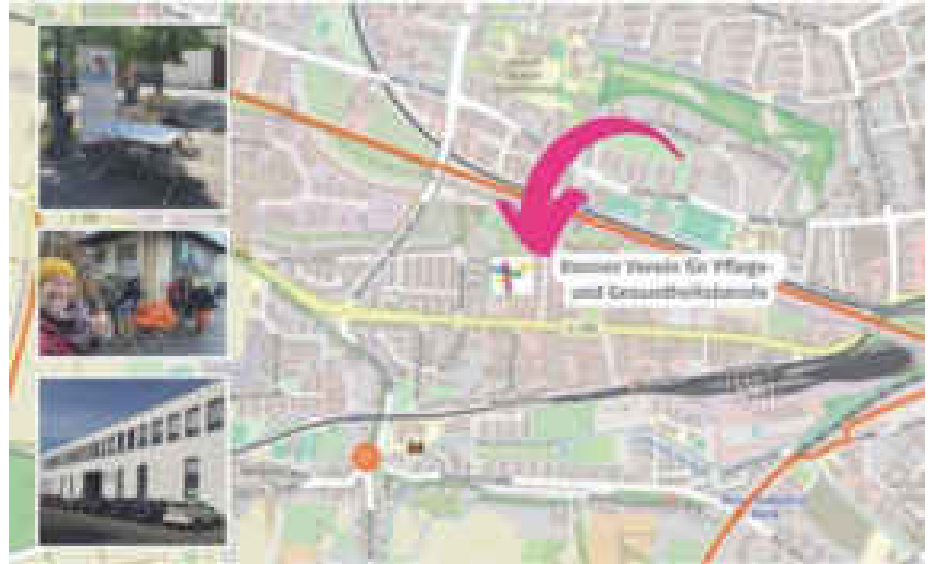
Hier finden Sie den Bonner Verein für Pflege- und Gesundheitsberufe e.V.

Deutsche Sprachkurse bereiten auf eine Sprachprüfung auf B1 oder B2 Niveau vor. In den Hauptschulkursen kann der